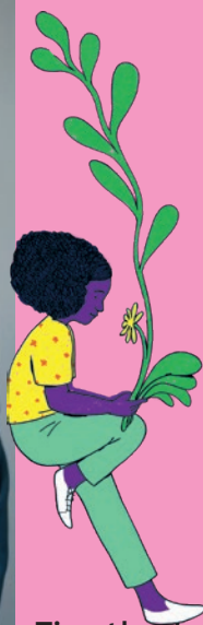
Timothy de Gilde Hoofd programmering en perspectief